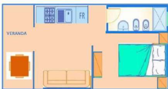
BILO AM MEER